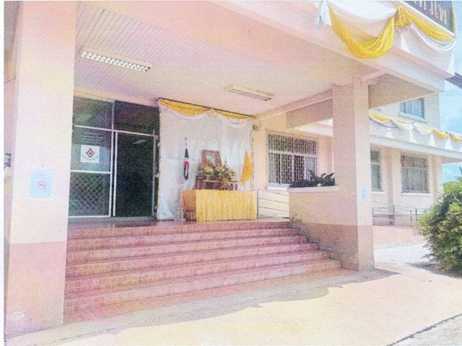
บริเวณทางเข้าอาคารสำนักงาน อบต.หัวโพ