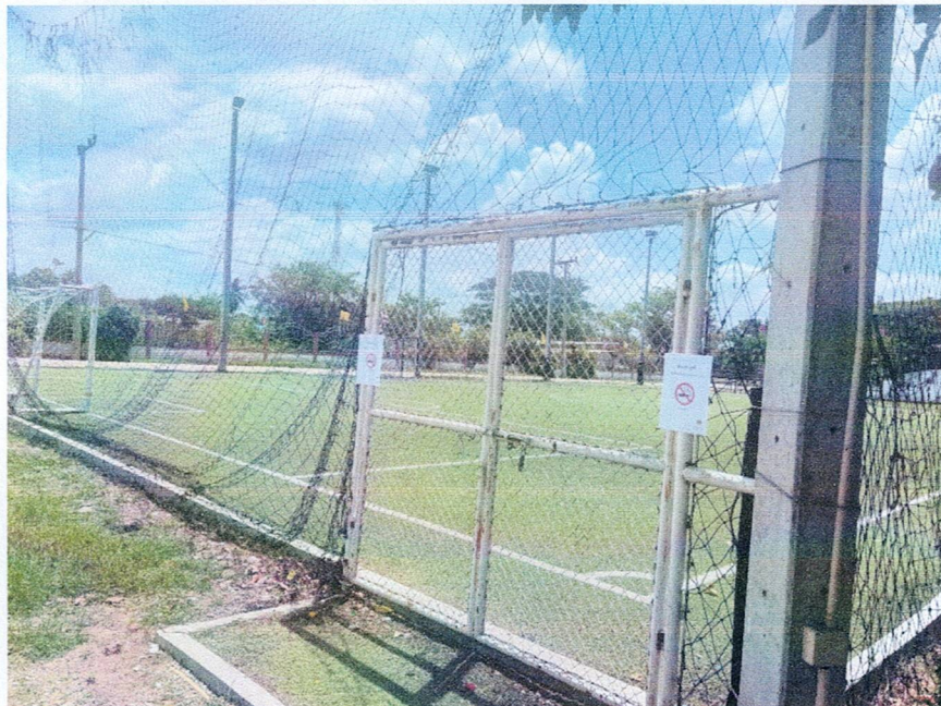
บริเวณสนามกีฬาของ อบต.หัวโพ